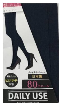
ネイビー -16 M/L L/LL