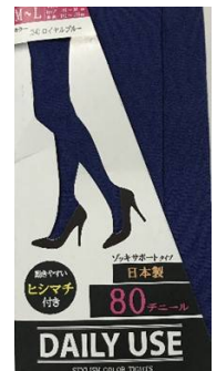
ロイヤルブルー -34 M/L L/LL