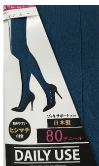
ブルー -06 M/L L/LL