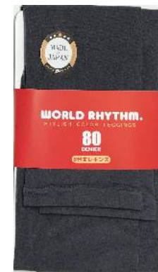
チャコールグレー -15