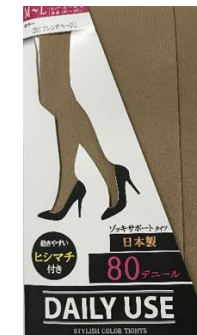
フレンチBE -38 M/L L/LL