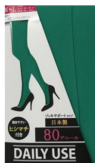
エメラルドグリーン -32 M/L L/LL