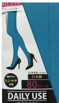
トルコブルー -31 M/L L/LL