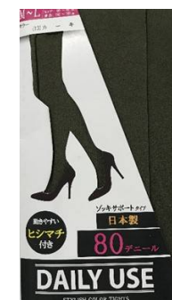
カーキ -13 M/L L/LL