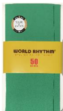
エメラルドグリーン -32