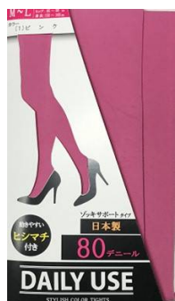
ピンク -01 M/L L/LL