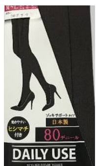
ブラウン -14 M/L L/LL