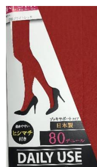
ブライトレッド -35 M/L L/LL