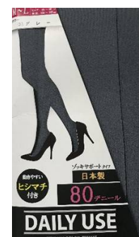
グレー -33 M/L L/LL