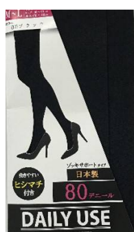
ブラック -17 M/L L/LL