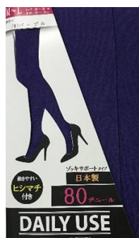
パープル -08 M/L L/LL