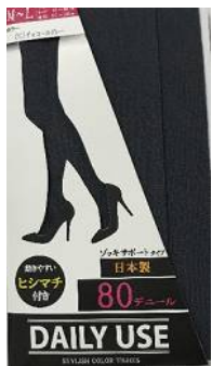
チャコールG -15 M/L L/LL