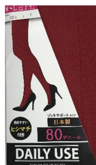
レッド -22 M/L L/LL