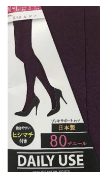
ボルドー -11 M/L L/LL