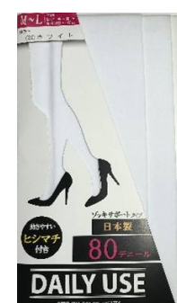
ホワイト -24 M/L L/LL