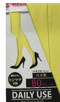
イエロー -30 M/L L/LL