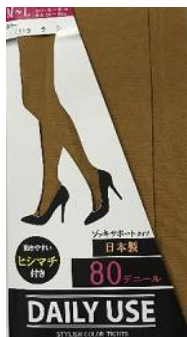
カラシ -03 M/L L/LL