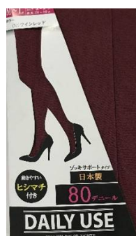
ワインレッド -10 M/L L/LL